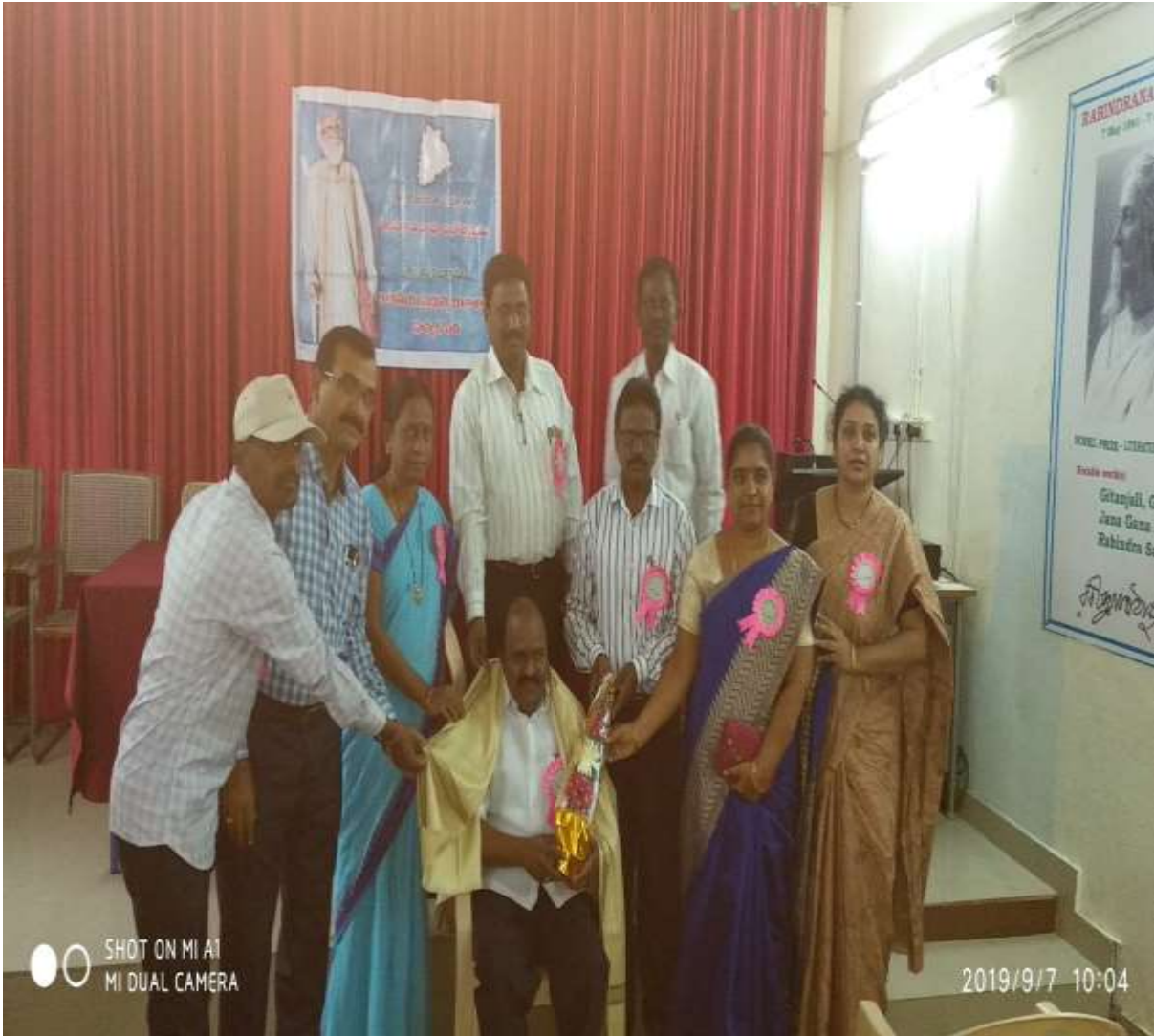
Felicitation to the Resource Person Professor Banna Ilaiah